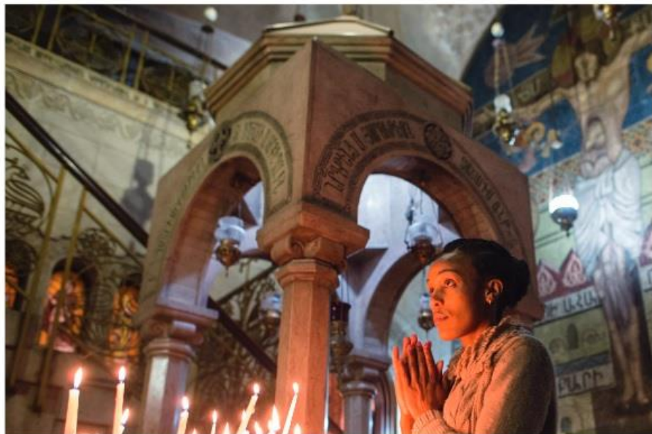
Gott - Mensch - DIN 44 Art. Nr. 119 211 300 DIN Ag Art. Nr. 119 211 170

Geben Sie das große Geschenk weiter! Helfen Sie, besonders zum Weihnachtsfest, damit Menschen überall auf der Erde in Würde leben können. Brot für die Welt hat dafür viele Möglichkeiten. In mehr als 1.000 Projekten weltweit machen wir Menschen wieder fähig, sich selbst zu helfen. Geben auch Sie ein Stück Gerechtigkeit dazu! Danke!